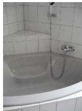
Bad mit Eckwanne und Dusche